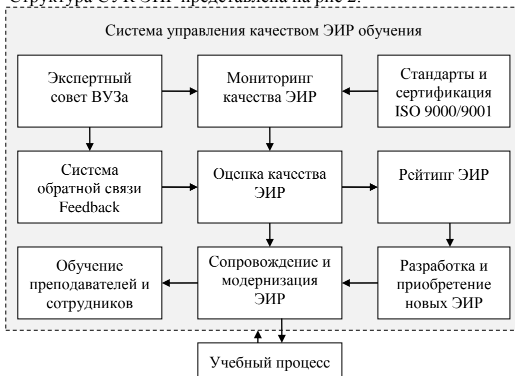
Рис 2. Структура системы управления качеством ЭИР

Структура СУК ЭИР представлена на рис 2.